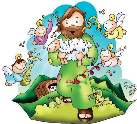
___ G ___