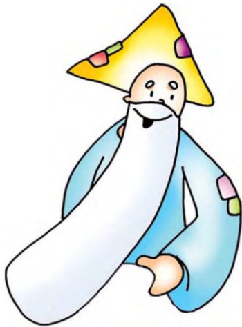
___ D ___