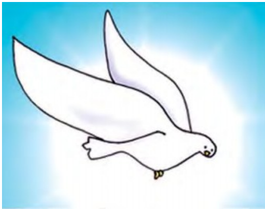
___ R ___